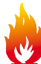
60 P NT Fire 017