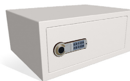
Elkodlås på låsbart fack